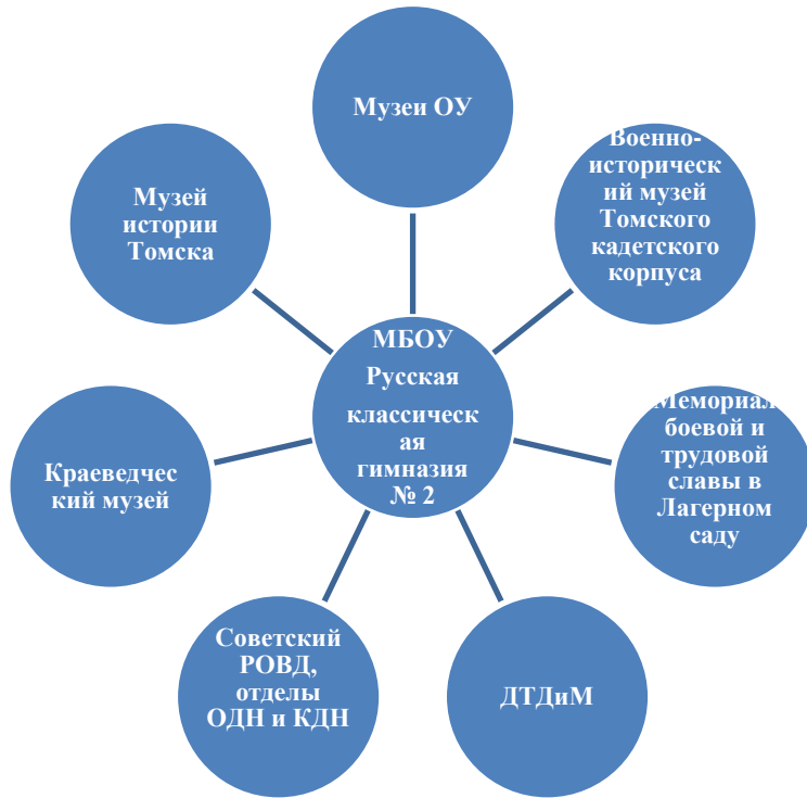
Схема реализации нравственно-правового и патриотического направления социализации обучающихся