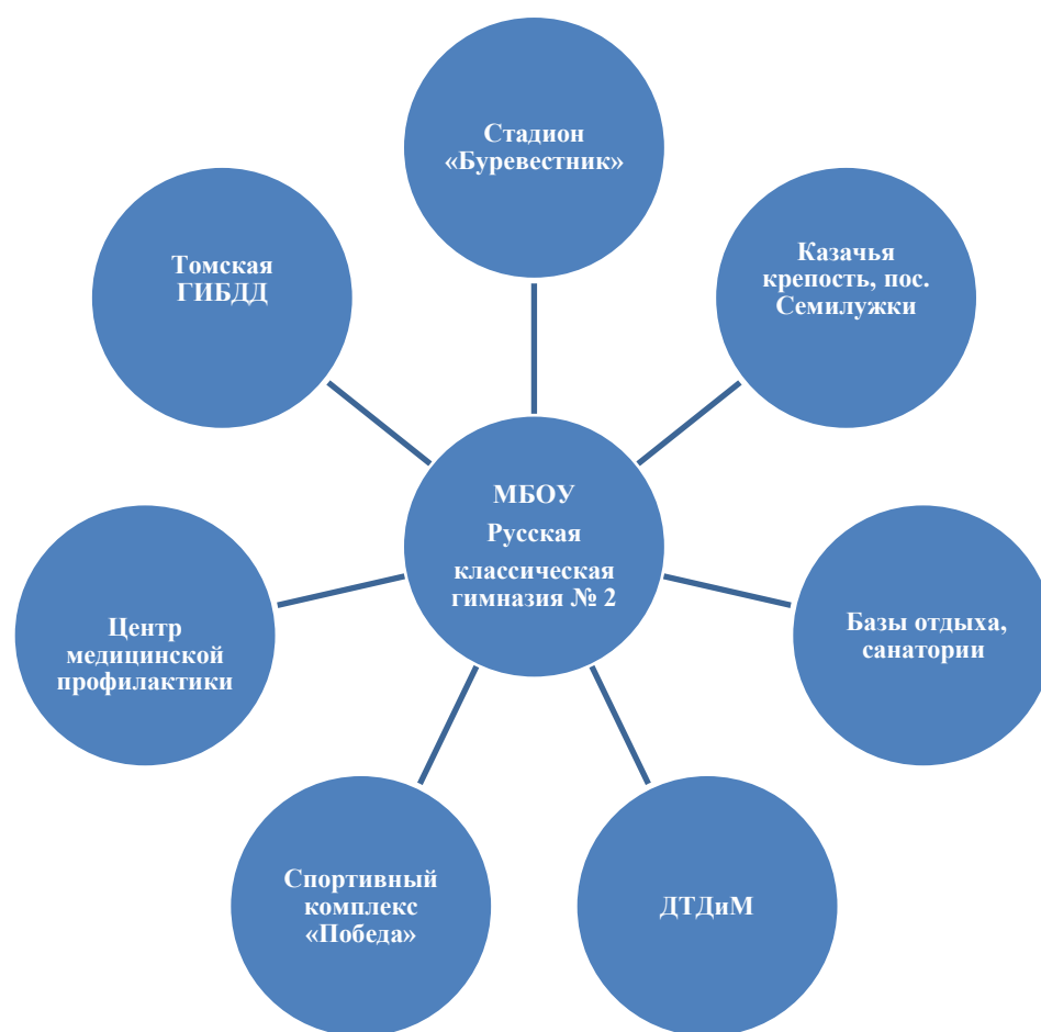
Схема реализации спортивно-оздоровительного направления социализации обучающихся