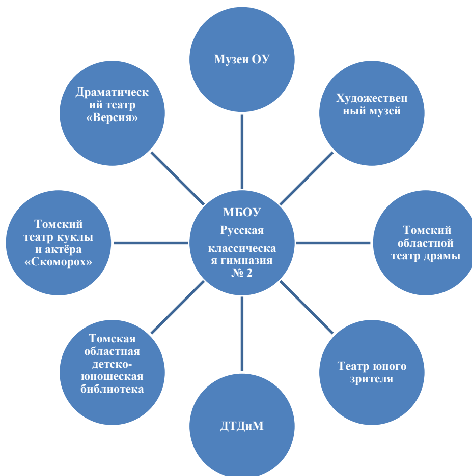
Схема реализации художественно-эстетического направления социализации обучающихся